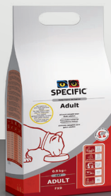
FXD: 0,9 kg