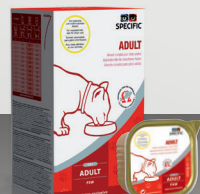
FXW: 7 x 100 g