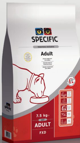
FXD: 7,5 kg