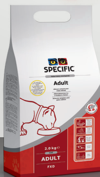
FXD: 2 kg