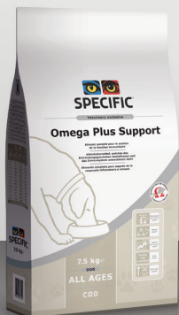
Iho- ja turkkiongelmat